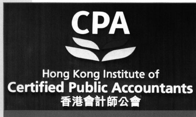
香港會計師公會是香港唯一獲法例授權負責會計師註冊兼頒授執業證書的組織

中 小企包括了不少專業人士。例如，保險行業的理財顧問雖然推銷的只是某某保險公司理財產品或服務，但實質多是自顧者。另一個行業會計，除了「四大」，大部分都屬中小型機構。行業為了保障專業形象及操守行為，加上香港政府採取了信任式的行業自我監管態度，學會的成立及嚴格入會的資格，無可避免。