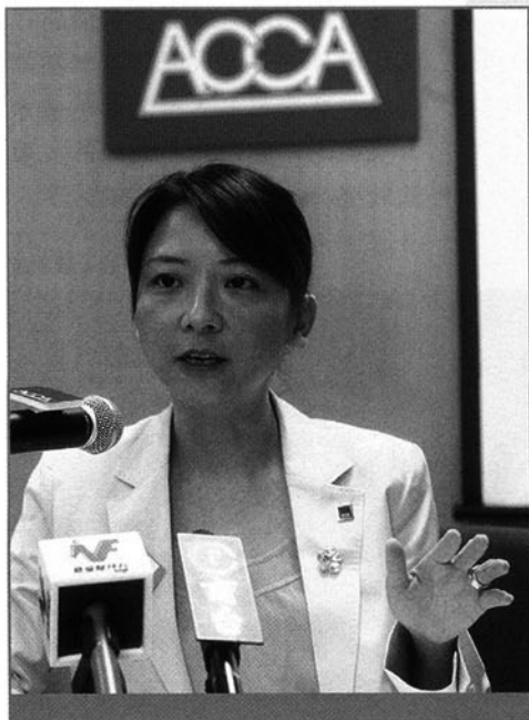
特許公認會計師公會（ACCA）會長周雪鳳

其次，在今年10月30日香港會計師公會與中國註冊會計師協會簽署的備忘錄，是一很清晰的方向。香港執業的會計未來的方向又怎樣