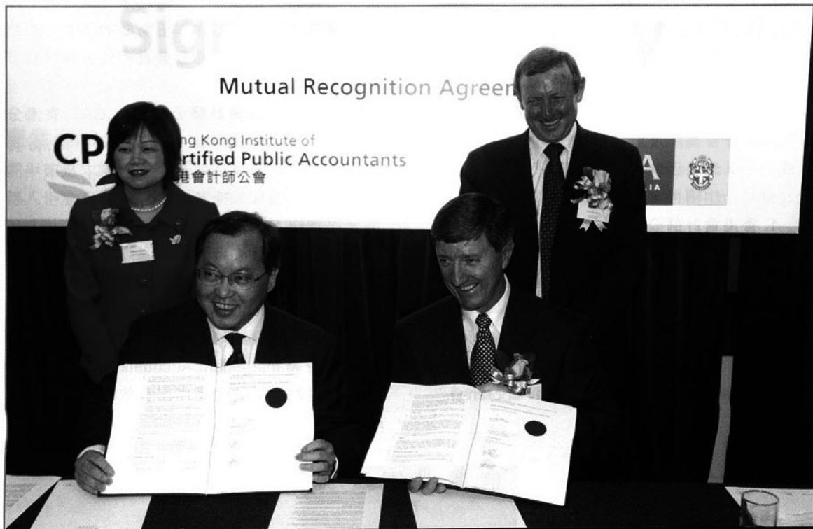
香港會計師公會與外國公會互認資格

3. 英國特許管理會計師公會 (CIMA) —— 英國特許管理會計師公會會籍，是世界工商界一致認同的最深資專業組織。總部位於倫敦，