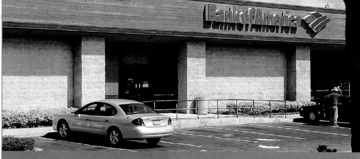
中小企要留意美國十大銀行資產回報的走勢

首，繼之是Bank of America和Citibank。那麼，讀者可以留意此十大銀行資產回報走勢做好準備。同樣，英國國家銀行（Bank of England）除了提供英國銀行資產回報走勢，也提供歐盟銀行資料。1998年南美發生金融風暴，當時的哥倫比亞銀行的銀行資產回報是1.03%。總括來說，目前是危險低於1%。銀行界一旦被迫收縮、重整、合併或破產，對經濟有何後果？