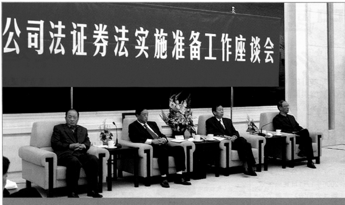
內地舉辦過不少有關《公司法》的座談會